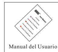
Manual del Usuario